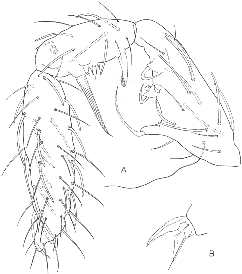
FIG. 5. — Sminthurides sensillatus n. sp. ♂. A, les trois derniers articles antennaires. — B, griffe de P3 en vue postérieure.

Ant. II : b1 placé sur une très grande bosse ; b2 et b3 , relativement bien développés, sur une bosse unique ; b4 sur une bosse séparée ; b5 sur la bosse distale. B1 se situe à la base de la bosse portant b1 . Seul Tra1 est présente. Cet article est pourvu de 8 sensilles.